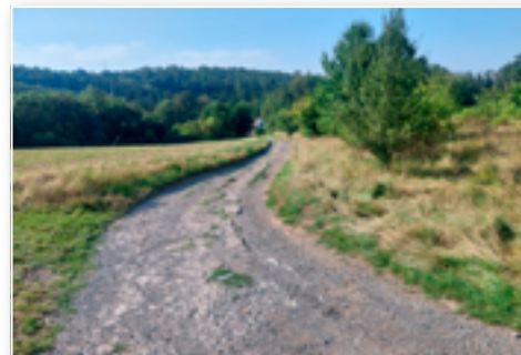
Ulice K Březině před opravou

vjezdových komunikacích kamerové zařízení nainstalováno a uvedeno do zkušebního provozu. Jedná se o zařízení splňující GDPR, jehož provozovatelem je obec Hrusice. Do kamerového systému není možné nahlížet on-line, ale vždy jen v souladu se správním řádem, tedy v případě podezření ze spáchání přestupku. Využití je tak převážně pro Policii ČR, kdyby byl v obci spáchán nějaký trestný čin a bylo by potřeba zjistit pohybující se vozidla po obci. Je-