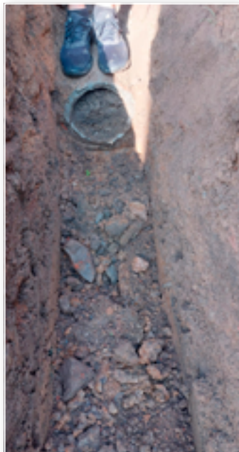
Přerušená dešťová kanalizace