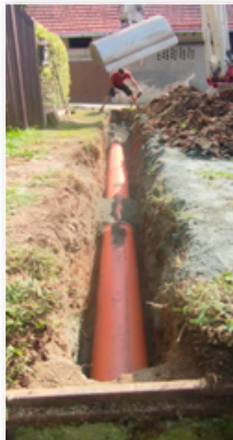
Oprava dešťové kanalizace

likož jsou kamery certifikovány a nastaveny na rozpoznávání registračních značek, může se na ně napojit Policie ČR a využít je k měření rychlosti. Kamery jsou spolu také propojeny a budeme tedy i pilotovat provoz v ulici Pod Kouty, kdy budeme prověřovat oprávnění průjezdu po této komunikaci.